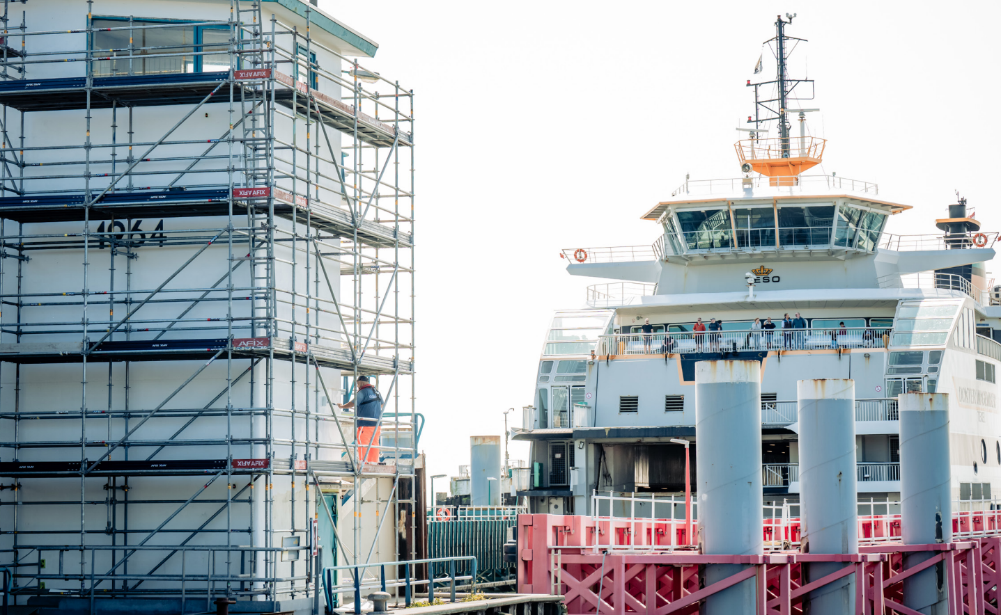
Rijkswaterstaat heeft de heftorens van de veerhavens van Texel en Den Helder in 2025 voorzien van een nieuwe deklaag verf.

Rijkswaterstaat staat voor een grote vernieuwingsopgave. Veel infrastructuur in Nederland – zoals wegen, bruggen en tunnels – is verouderd en toe aan onderhoud of vervanging. Dat geldt ook voor de veerhavens van Den Helder en Texel. We willen de aanlandinrichtingen in deze havens dan ook zo snel mogelijk vernieuwen. Wanneer dat precies gebeurt, is nu nog niet duidelijk.